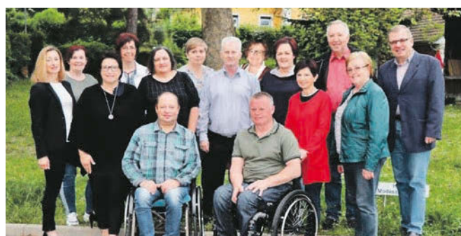
Der Vorstand der Behinderten-Selbsthilfe-Gruppe Hartberg.

Büroöffnungszeiten: Montag – Donnerstag von 8 bis 14.30 Uhr und Freitag von 8 bis 12.30 Uhr.